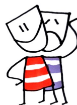
Kulttuuri- ja taidealan toimijat