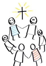
Hämeen parhaaksi - seurakuntien verkosto