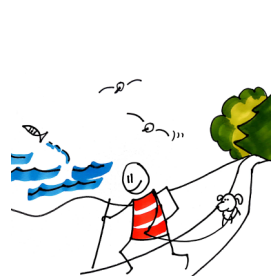
Ympäristö- ja luontoyhdistysten yhteistyöfoorumi