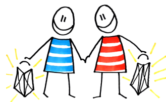
Päty – päihdejärjestöt ja toimijat