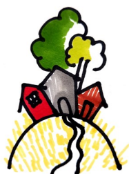
Kylä-, kotiseutu- ja asukastoimijat