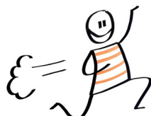
Liikuntaseurayhteistyö – seuraparlamentti