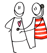
Ote-tiimi – Omais- ja terveysalan toimijat